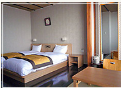
和風ツインベッドと小上がりのある洋室

平成20年1月より一般公募により名称を変更した『食彩の宿 いいおか』(旧国民宿舎飯岡荘)は、施設の老朽化と機能や設備が一昔前の水準に留まっているものを現代的な水準まで高めて、旅行慣れしている首都圏住民の宿泊施設に対する基本的なニーズに応えようと、2年度に渡り営業を中断することなく、外壁塗装、客室及びレストラン、売店の改修工事等を行った。オーシャンビューのモダンで清潔感あふれる客室は、観光や出張で快適に利用できるよう、全室にバス、トイレ、LAN配線を完備した。また旭市は、1年を通して様々な野菜や果物が豊富にとれ、味に定評のある畜産品とこれを使った加工品や、飯岡港にあがる活きの良い魚貝類など料理に必要な食材が豊富にあることから、食事を地元の旬で新鮮なものを中心とした料理に見直し、家族、仲間、恋人同士が海を見ながらゆったりとレストランで楽しみ、思い出に残る時間を過ごせるよう接客サービスとともに改善を行った。