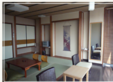
ファミリーで楽しむなら和室がおすすめ