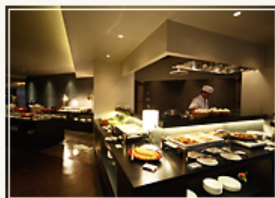
旬の丸内のオープンキッチン、ビュッフェ台

09年4月には、従来の食事処であった「食事処 旬の丸」を「ダイニング 旬の丸」と名称を改め、約3倍近くの広さに拡張してリニューアルオープン。エリア毎に和モダン、蔵造り風など趣が異なる設えとし、オープンキッチンを新設して、朝食のビュッフェ形式での提供への転換を図った。「萩の朝ごはん」をイメージした朝食バイキング、週末開催される春夏秋冬ランチバイキング(別料金)、新鮮な食材を目の前で調理する別注料理が好評の夕食など、3つのシーンが楽しめるダイニングとなっている。