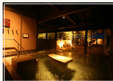
回遊型の多様な半露天から中庭を望む