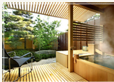
温泉を引き込んだ縁の客室露天風呂