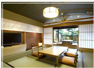
越前和紙を使用した2.5畳の主室

更に、第三期として08年7月、本館1階にひとクラス上のスイートタイプで全室庭園露天風呂(温泉)付の別邸「美悠」8室の改修工事を実施。別邸「美悠」は専用コンシェルジュ、チャージフリーの専用ラウンジが設置され、客室は主室(和室)の他にリビング、和モダンベットルームがあり、朝食用の専用小上がりを設置、プライバシーに配慮された和みの空間を構築している。