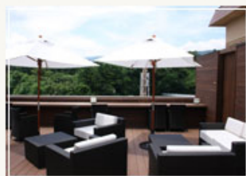
足湯スカイテラス「湯め風～YUMENAGI～」